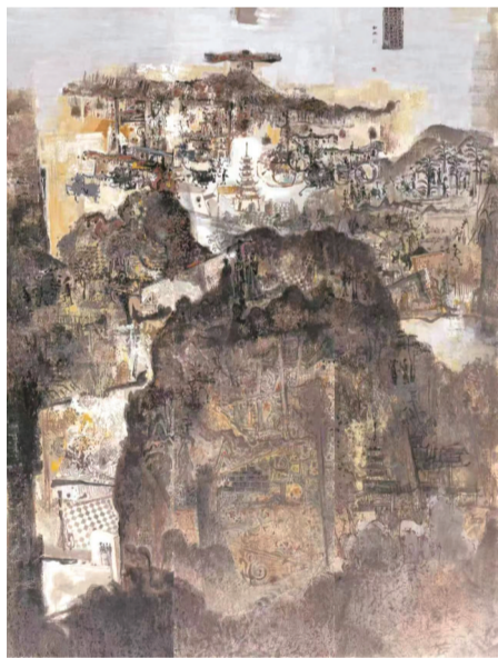
刘泉《轩辕遗韵》240cm×180cm 中国画 2023年

在河南郑州生活、工作多年的刘泉,对轩辕黄帝有独特的情结。2023年11月,当看到“轩辕情 中国梦——2024·全国中国画作品展”的征稿信息时,刘泉决定进行自我革新、自觉求变,主动调整个人的绘画风格,尝试借助水墨语言,创作一幅反映轩辕遗韵、中原历史、中华文明的中国画作品。最终,她用3个多月时间创作出了《轩辕遗韵》。